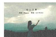
Masaco 「むこう岸」 那須フラワーワールド