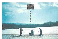
Su凸ko D凹koi 「戻れないふたり」 那須高原 草原