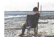
水あ涼 海城学園 那須高原 草原