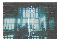
それでも世界が続くなら 「次回作」 ホテル