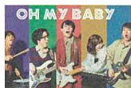
LUCY IN THE ROOM 「Oh my baby」 サッポロビール那須工場

那須フィルム・コミッションが撮影協力した、ミュージックビデオを上映いたします。那須の風景とともに楽しみください。