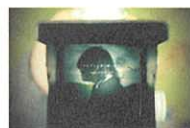
それでも世界が続くなら 「copy and delete」 那須高原 草原